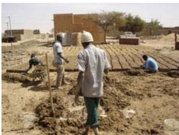
Préparation des briques pour le mur de clôture février 2009